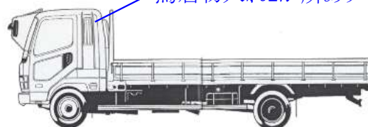
あゆみ収納スペース